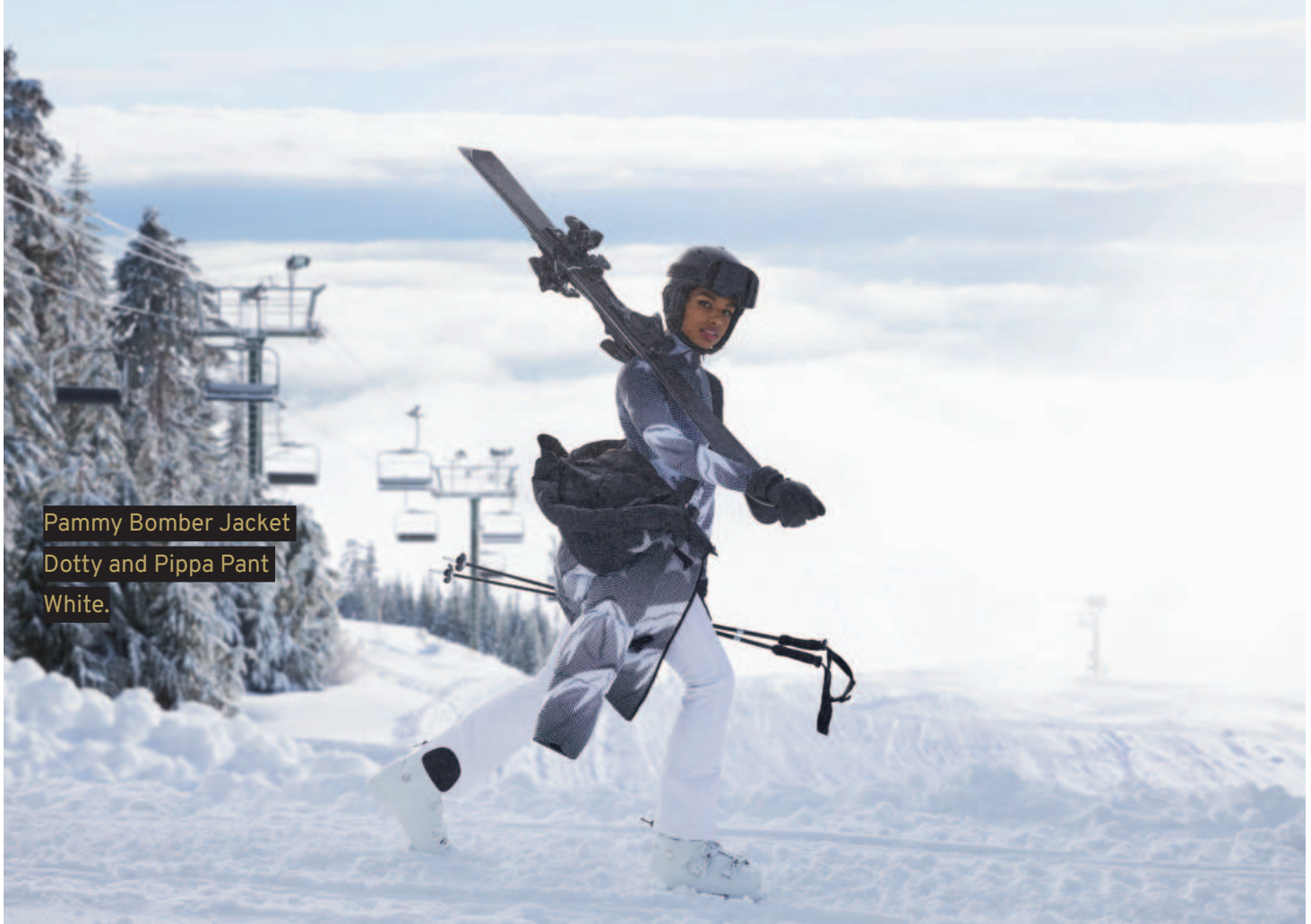
Pammy Bomber Jacket Dotty and Pippa Pant White.