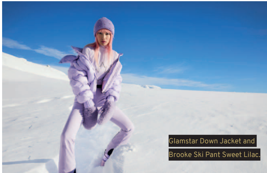
Glamstar Down Jacket and Brooke Ski Pant Sweet Lilac.

OUR SIGNATURE STYLE IS FIERCELY FEMININE WITH A CLASSIC SILHOUETTE AND SURPRISING, HEAD-TURNING FASHION ELEMENTS.